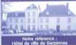
Notre référence : Hôtel de ville de Gerpennes

Service rapide Le numéro 1 de votre région