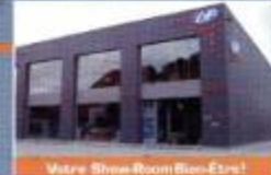
Votre Show Room Bien-Être!

La construction d'une piscine ne s'improvise pas. Renseignez-vous dès maintenant!