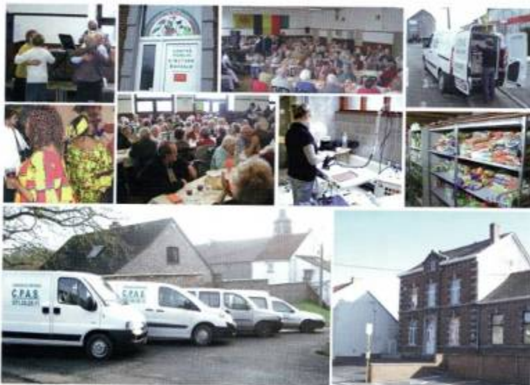
Le C.P.A.S. de Gerpinnes