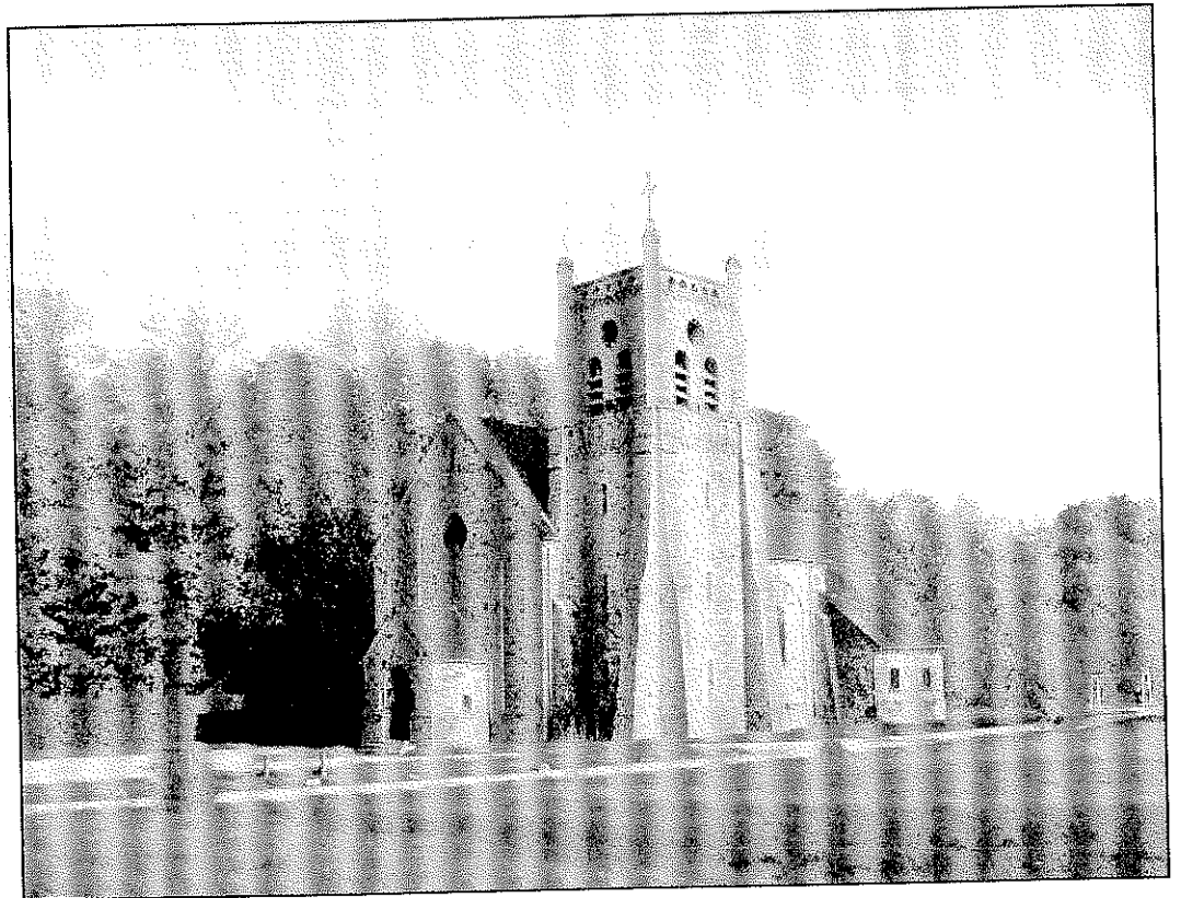
«Eglise de Lausprelle»